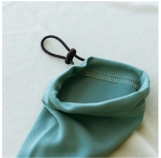
二の腕のずり落ちを防ぐ「アジャスター設計」