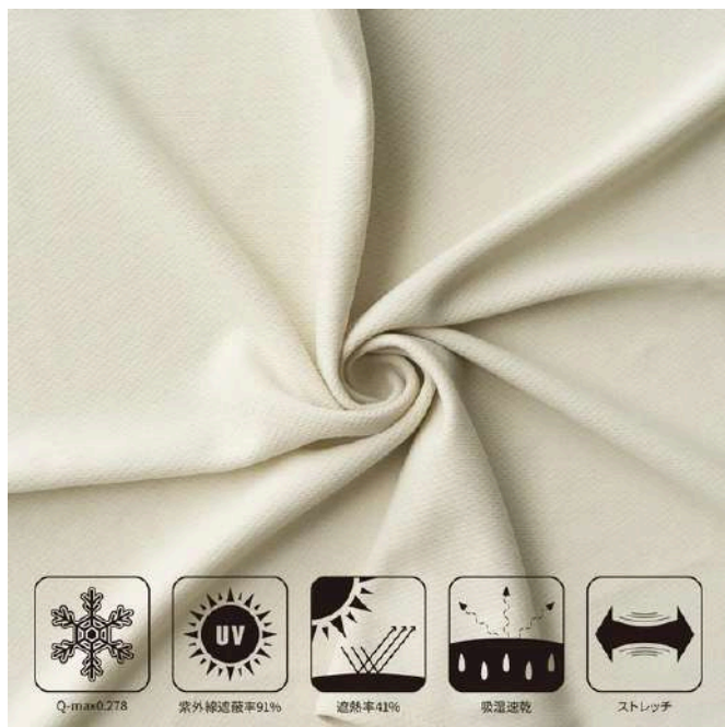
過酷な夏を支える5つの機能

：見た目も涼しい「アイボリー」、DODの代名詞でもある「コズエブルー」、引き締まった印象の「ネイビー」の3色をご用意しました。