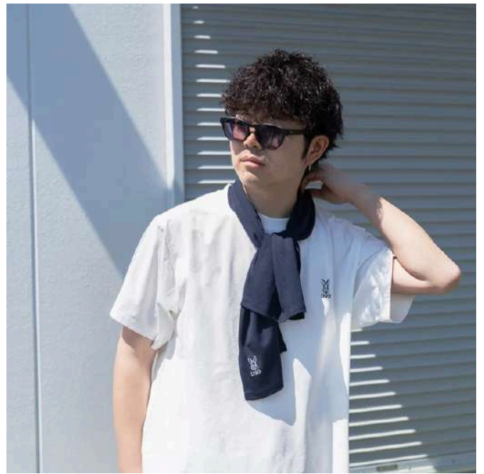
ロングサイズ設計