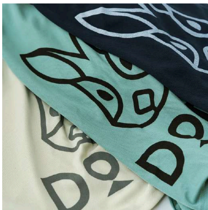
選べる3色のカラー展開