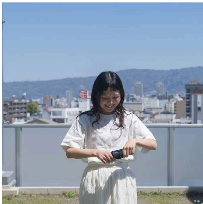
水で濡らして絞って着用・使用することで、気化熱を利用しひんやり感がさらにアップ