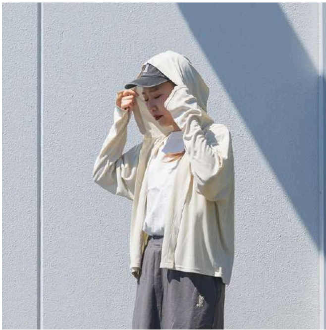
深めのフード仕様