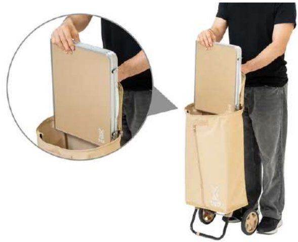
同シリーズ「 エンソクキャリア 」にフィット