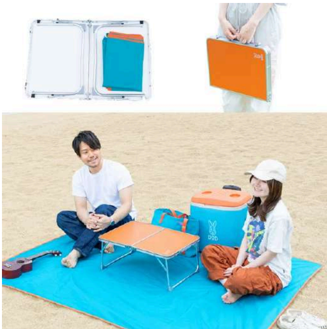
ウサンポレジャーシートLサイズ を収納

最大の特徴は先行して大ヒットしている手のひらサイズの「 ウサンポレジャーシートS/M/L 」を内部にすっぽりと収納できる点です。これまでは別々にバッグへ入れていた「シート」と「テーブル」が一つにまとまるため、忘れ物を防ぐだけでなく、移動時の荷物の体積を徹底的に削減。これ一つ掴めばすぐに外へ飛び出せる、圧倒的なタイプを実現しました。