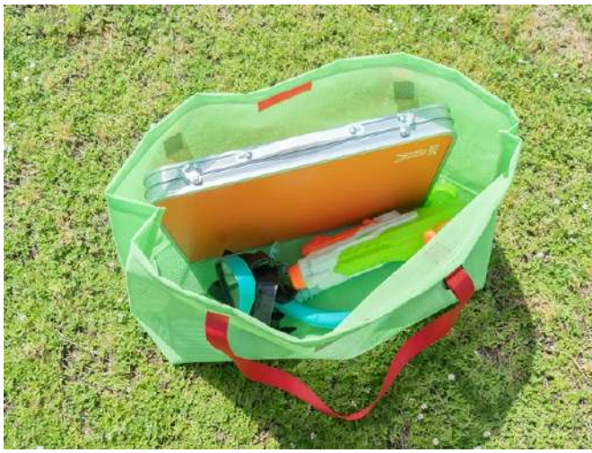
「 サマータイムあみちゃんMサイズ 」に収納