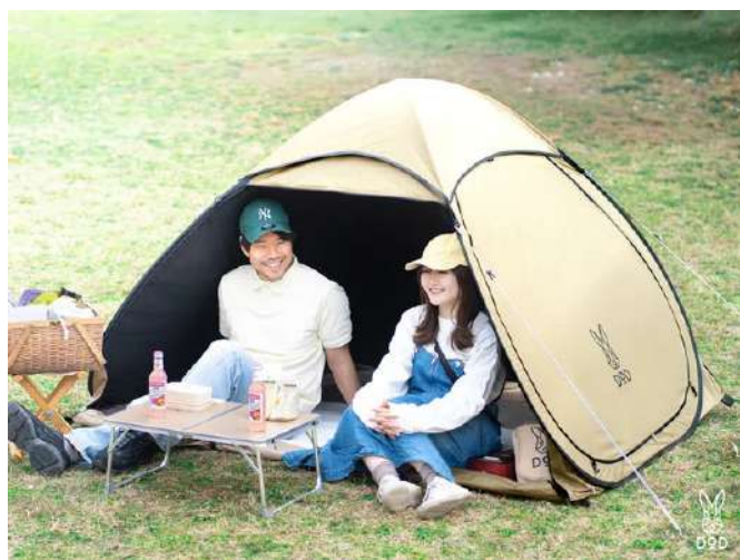
同シリーズのポップアップテント「 ポップリンシェード 」

製品ページ： https://www.dod.camp/product/tb2_270/