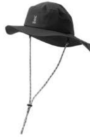
カッパーダ・ハット B K