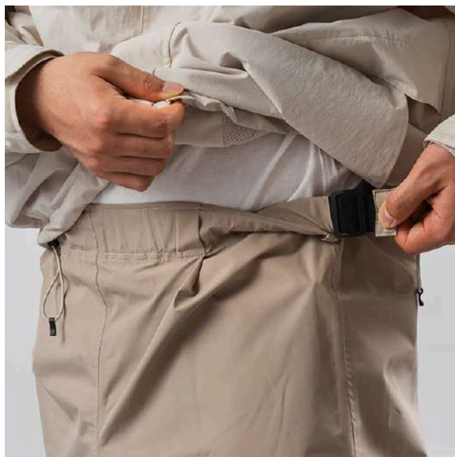
片手でサイズ調整できるアジャスト仕様