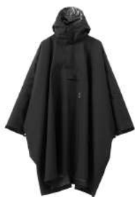
カッパーダ・ポンチョ BK