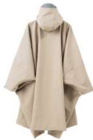
カッパーダ・ポンチョ BG