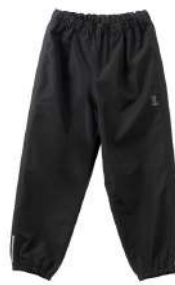
カッパーダ・パンツ K