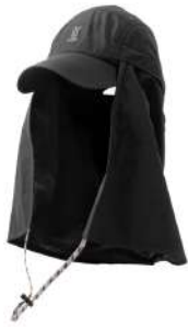
カッパーダ・キャップ BK