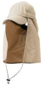
カッパーダ・キャップ BG