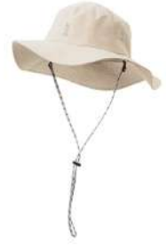
カッパーダ・ハットBG