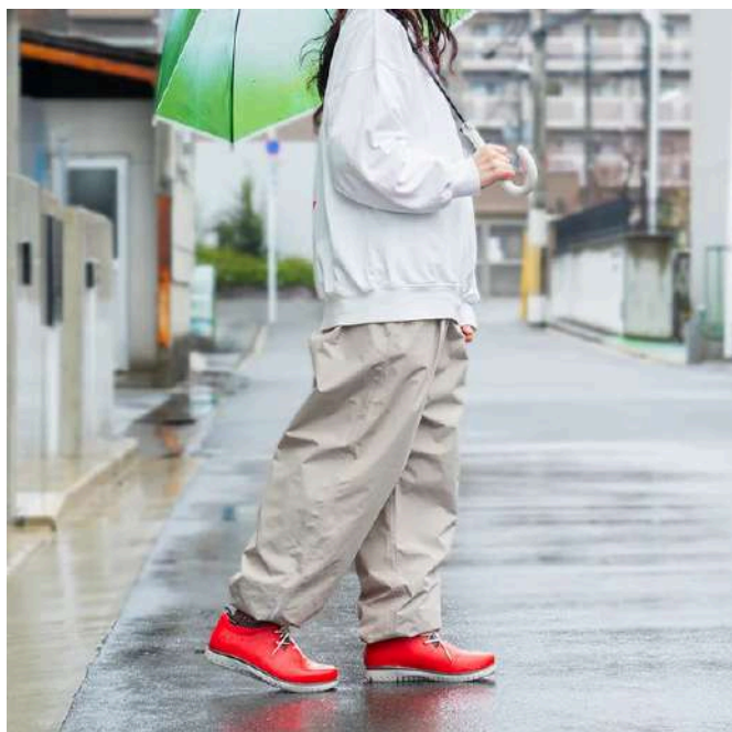
窮屈感のないゆとりあるテーパードシルエット

レインパンツ特有の“野暮ったさ”を感じさせないテーパード形状を採用し、街歩きでもご利用いただけるシルエットにしました。