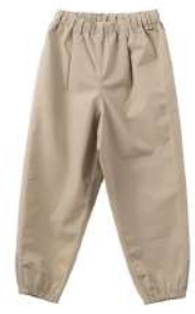
カッパーダ・パンツ G