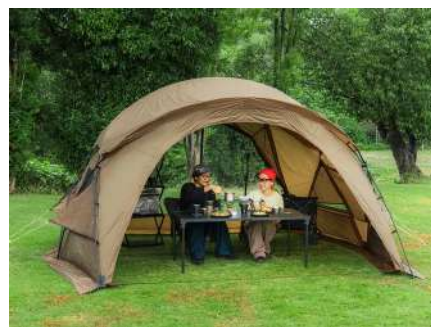
付属フライシート