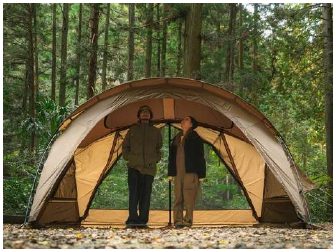
立って歩ける天井高