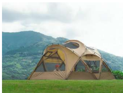
全面メッシュのドア&窓